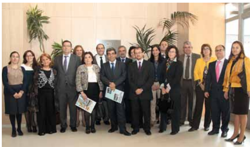
La directora del DAT Madrid Capital, con los equipos directivos de los Colegios GSD Vallecás (izquierda) y GSD Las Suertes.