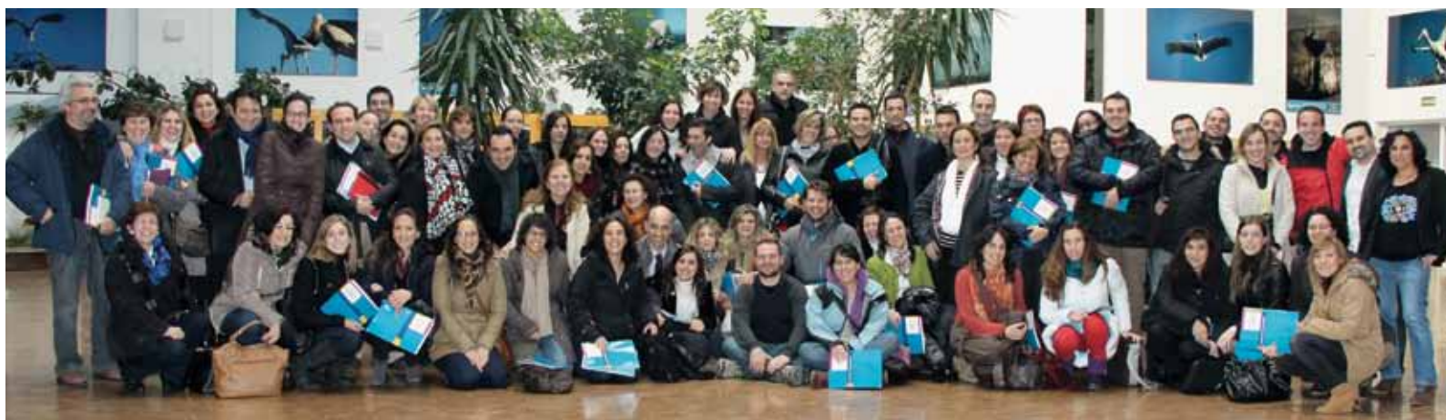
El numeroso grupo de docentes que estuvo en el Colegio Gredos San Diego Buitrago intercambiando información sobre el aprendizaje cooperativo.