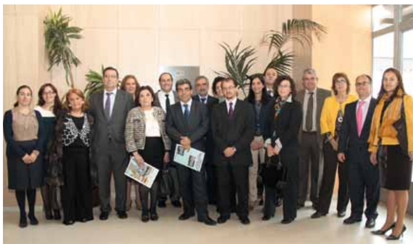
La directora del DAT Madrid Capital, con los equipos directivos de los Colegios GSD Vallecas (izquierda) y GSD Las Suertes.